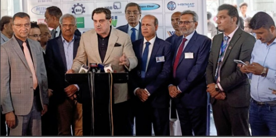
لاہور۔ وزیر ذہنی صحت اور برقی امور پیش کش اور ڈاکہ کار ہار میں تین روزہ معاہدہ ترقی کے اقدام پر گروپ فوٹو

سیکرٹری امور خارجہ اور بی بی سی کے انٹرویو میں سعودی عرب کے سفیر نے پاکستان اور سعودی عرب کے درمیان تعلقات کو مزید مضبوط کرنے پر متفق ہونے کا اعلان کیا۔