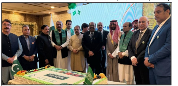
سعودی عرب کے قومی دن پر جدہ میں پاکستانی صحافیوں کی تقریب، ایک کانٹاکا گیا

جدا (نامہ نگار) سعودی عرب کے 95 ویں قومی دن کی مناسبت سے پاکستان انویٹرز فورم کے زیر اہتمام ایک پروکار تقریب منصفہ ہوئی جس کے مہمان خصوصی شہزادہ سعود بن سیف الاسلام بن عبدالعزیز تھے۔ تقریب میں پاکستانی کمیٹی کے اراکین سمیت سیاسی، سماجی اور سفارتی شخصیات کی بڑی تعداد نے شرکت کی۔ اس موقع پر پاکستان اور سعودی عرب کے دو بے تعلقات شاہ سلمان بن عبدالعزیز اور مہمان خصوصی شہزادہ سعود بن سیف الاسلام بن عبدالعزیز نے ایک ٹیبل ٹاک کی۔ تقریب میں پاکستانی کمیٹی کے اراکین سمیت سیاسی، سماجی اور سفارتی شخصیات کی بڑی تعداد نے شرکت کی۔ اس موقع پر پاکستان اور سعودی عرب کے دو بے تعلقات شاہ سلمان بن عبدالعزیز اور مہمان خصوصی شہزادہ سعود بن سیف الاسلام بن عبدالعزیز نے ایک ٹیبل ٹاک کی۔ تقریب میں پاکستانی کمیٹی کے اراکین سمیت سیاسی، سماجی اور سفارتی شخصیات کی بڑی تعداد نے شرکت کی۔ اس موقع پر پاکستان اور سعودی عرب کے دو بے تعلقات شاہ سلمان بن عبدالعزیز اور مہمان خصوصی شہزادہ سعود بن سیف الاسلام بن عبدالعزیز نے ایک ٹیبل ٹاک کی۔