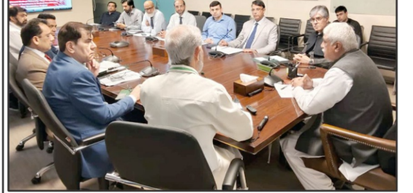
لاہور۔ سوہانی وزیر صحت اور برقی امور پیش کش اور ڈاکہ کار ہار میں تین روزہ معاہدہ ترقی کے اقدام پر گروپ فوٹو

سیکرٹری امور خارجہ اور بی بی سی کے انٹرویو میں سعودی عرب کے سفیر نے پاکستان اور سعودی عرب کے درمیان تعلقات کو مزید مضبوط کرنے پر متفق ہونے کا اعلان کیا۔