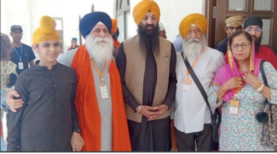
لاہور۔ سوہانی وزیر صحت اور برقی امور پیش کش اور ڈاکہ کار ہار میں تین روزہ معاہدہ ترقی کے اقدام پر گروپ فوٹو