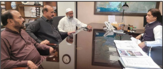
کشمیر راولپنڈی کی ان لینڈ سٹریٹریٹور انفران کو بریفنگ

ریلوے کو بہتر سے بہتر بنانے کیلئے مختلف منصوبہ جات پر تیزی سے عمل جاری ہے، چیف ایگزیکیوٹو آفیسر سرگودھا (نامہ نگار) ریلوے کے چیف ایگزیکیوٹو آفیسر نے کہا ہے کہ ریلوے کو بہتر سے بہتر بنانے کیلئے مختلف منصوبہ جات پر تیزی سے عمل جاری ہے۔ انہوں نے کہا کہ ریلوے کو بہتر سے بہتر بنانے کیلئے مختلف منصوبہ جات پر تیزی سے عمل جاری ہے۔ انہوں نے کہا کہ ریلوے کو بہتر سے بہتر بنانے کیلئے مختلف منصوبہ جات پر تیزی سے عمل جاری ہے۔