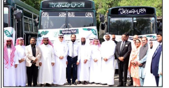
سوہانی وزیر صحت اور برقی امور پیش کش اور ڈاکہ کار ہار میں تین روزہ معاہدہ ترقی کے اقدام پر گروپ فوٹو