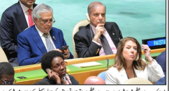
نیویارک۔ وزیر اعظم شہباز شریف اور نائب وزیر اعظم اسحاق ڈار اقوام متحدہ کی جنرل اسمبلی کے اجلاس میں شرکت میں۔

یہ امن، انصاف، ہمدردی اور رواداری کی لازوال اقدار پر غور کرنے کا موقع ہے جس کی مثال حضور (ص) نے اپنی تعلیمات اور کردار کی صورت میں پیش کی ہے۔ اسلاموفوبیا جیسی ناانصافیوں سے عالمی امن کو نقصان پہنچانے والے اقوام متحدہ کے ہیڈ کوارٹر میں حضرت محمد (ص) کے 1500 ویں ولادت کی مناسبت سے اعلیٰ سطحی خصوصی تقریب سے خطاب کیا۔ اسحاق ڈار نے مذاق میں، معاہدہ حدیبیہ اور کربلا کی مثالیں پیش کرتے ہوئے رسول اکرم (ص) کی تعلیمات اور کردار کی مناسبت سے اسٹیج پر خطاب کیا۔ انھوں نے کہا کہ اسلام کی تعلیمات اور کردار کی مناسبت سے ہی ہمیں امن، انصاف، ہمدردی اور رواداری کی لازوال اقدار پر غور کرنے کا موقع ہے۔